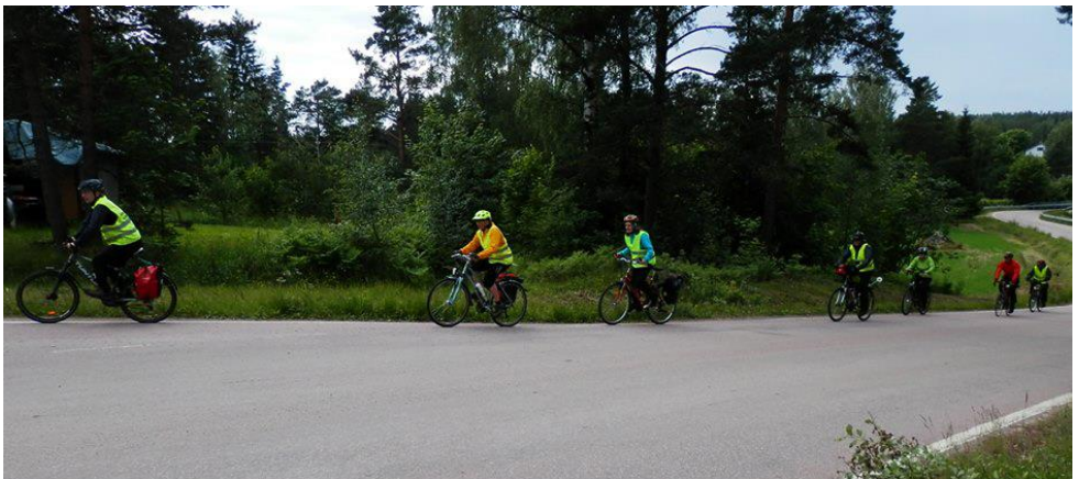
Matkalla Virolahden leiripäiville.

HUOMIO PERHEJÄSENET: Syksyn aikana eri osoitteissa asuvat "perhejäsenet" tulevat saamaan kirjeen. Siinä kerrotaan että perhejäsenyys on tarkoitettu samassa taloudessa asuville aikuisille ja heidän lapsilleen. Mikäli eri osoitteessa asuvat perhejäsenenä olevat aikuiset haluavat jatkaa jäsenyyttään yhdistyksessä, heidän tulee muuttaa jäsenmuotonsa.